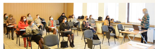
Završna konferencija u Rumunjskoj