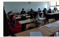
Konferencija u Hrvatskoj