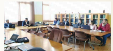
Konferencija u UK