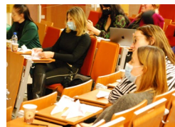
Konferencija u Poljskoj