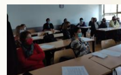
Conferința în Croația