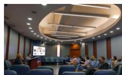
Conferința în Bulgaria

Toate țările partenere au organizat conferințe locale pentru a disemina rezultatele proiectului. La fiecare eveniment au participat minimum 25 de participanți din cadrul grupului țintă și al actorilor relevanți pentru proiectul UniCulture.