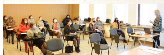
Conferința finală în România