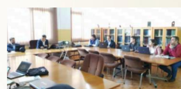
Conferința în Regatul Unit