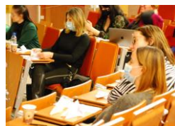
Conferința în Polonia